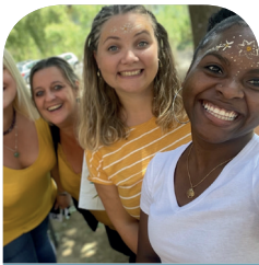
Petite pause pour Mayotte avant la dernière ligne droite

LE RESPECT DES RÉFÉRENTIELS TOUT EN PRÉSERVANT L'ÉQUILIBRE DE L'ALTERNANCE (MFR / STAGES - APPRENTISSAGE)