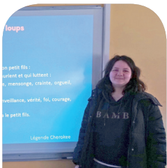
Intervention de l'associa- tion Totem «Respect entre personnes - Moi & Toi»