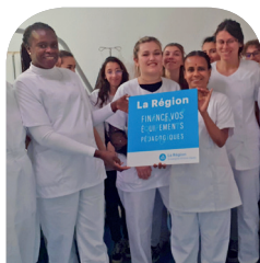
L'aide de la Région Auvergne Rhône Alpes pour nos aides soignants