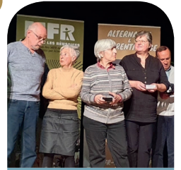
Faites de l'alternance !

LA VALORISATION DE LA RÉUSSITE, DES SAVOIRS, DES SAVOIR-FAIRE ET SAVOIR-ÊTRE