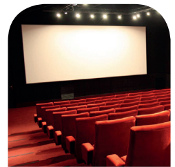
Lycéens et apprentis au cinéma

DES PROJETS ET DES ACTIONS ÉPHÉMÈRES OU DURABLES POUR TOUS