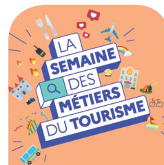
Semaine des métiers du tourisme