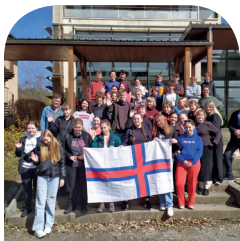
Echange avec des élèves des Iles Féroé !