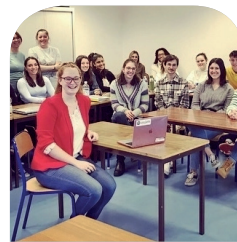
Partage d'expérience entre anciens et nouveaux élèves du BTS Tourisme

LE RESPECT DES RÉFÉRENTIELS TOUT EN PRÉSERVANT L'ÉQUILIBRE DE L'ALTERNANCE (MFR / STAGES - APPRENTISSAGE)